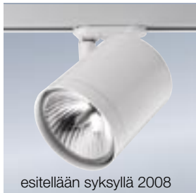
esitellään syksyllä 2008

LS-3 virranottimella 2041894 valkoinen 2041895 hopea 2041896 musta