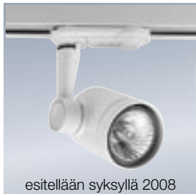
esitellään syksyllä 2008

LS-3 virranottimella 2041882 valkoinen 2041883 hopea 2041884 musta