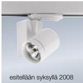
esitellään syksyllä 2008

LS-3 virranottimella 2041900 valkoinen 2041901 hopea 2041902 musta