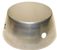
Suojakuppi 586 Ø253, korkeus 140, koodi: 4209899