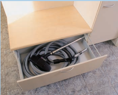
Letku on helppo säilyttää ja ottaa käyttöön.