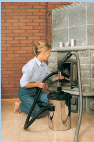
Esierottelijan avulla voit imuroida tuhkan lisäksi mm. kosteaa ainesta.

■ Puzer keskuspölynimurijärjestelmään on saatavana useita siivousta helpottavia lisävarusteita.