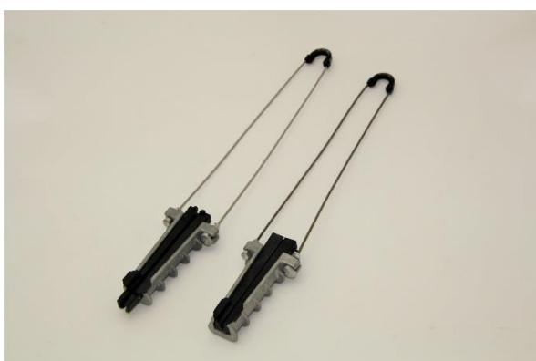
ADSS-kaapeleiden pääteripustimet eri kaapelikokoille