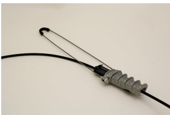
ADSS-kaapeleiden pääteripustin asennettuna