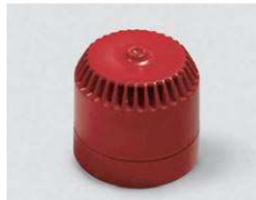
Sireeni 230 Vac

Muita lisävarusteita esim. salamavilkkuvaloja sireenin yhteyteen voi kysellä SLO kautta ja uuden FRIEDLAND tuoteluettelon sivuilta.