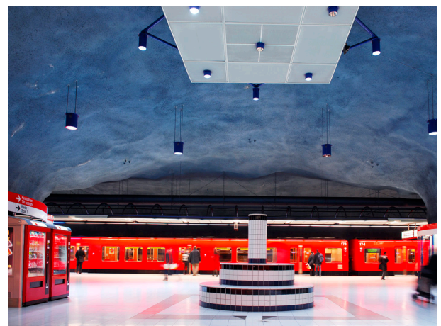
Ruoholahden metroasemalla käytetään Aura Unique-lamppuja

Aura Long Life -loistelamput on valmistettu standardin IEC/EN 60081 mukaisesti. Jatkuva tiukka laaduntarkkailu varmistaa Auran lamppujen erittäin korkean laadun. Saadaksesi lisätietoja vieraile internetsivuillamme tai ota yhteyttä Aura Light edustajaan.