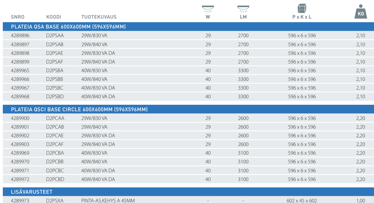
Plateia asennuskehys A