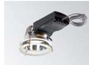
Laaja valikoiman koristeita.