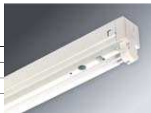
Perusrunko on myös yksi markkinoiden helpoimpia asentaa

tuotepäällikkö Pasi Nilanen puh. 010 283 2353 tai pasi.nilanen@slo.fi