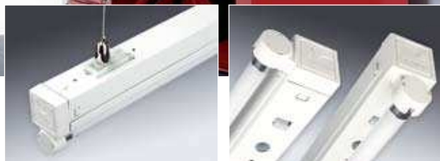
Laajan tarvikevalikoiman ansiosta C40 valaisimia voidaan helposti käyttää erilaisissa ympäristöissä. Päätykappaleita voidaan kallistaa 90° ja sijoittaa loistelamppu valaisimen alle tai sivulle.