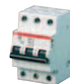
S203-C16 32 106 16