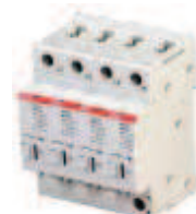
OVRT24L40275P 58 018 42