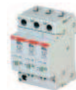
OVRT23L40275P 58 018 32