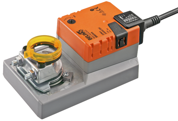
Kuva voi poiketa tuotteesta