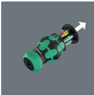
Avattava kahva, jonka sisässä kuuden Bits-kärjen lipas.