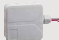
Mobiili etäkäynnistys- järjestelmä FS-SY