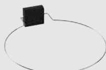
Kiukaan turvalaite SFE-D350 SFE-D450 SFE-D530