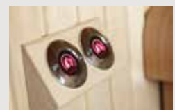
Löylyautomaatti Autodose SASL1