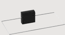
Kiukaan turvalaite SFE-220400