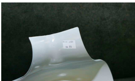
Vali nurk arvestades toru läbimõõtu ja isolatsiooni paksust