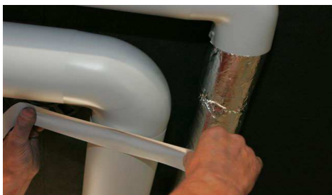
Vuugid kata PVC teibiga