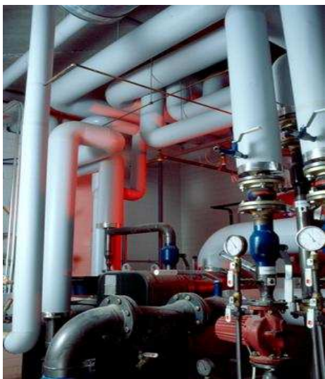
Teostatud tööde tulemus on ilusa väljanägemisega