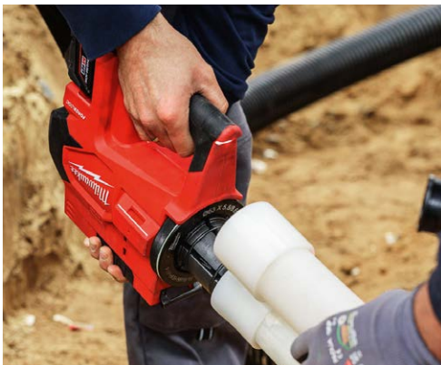
M18 VLD PEX -laajennustyökalu