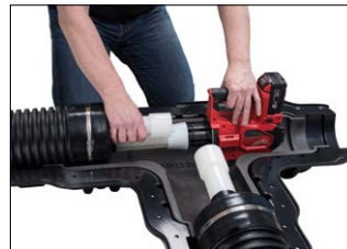
Laajenna putken pää.