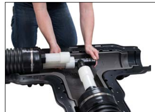
Asenna laajennettu putken pää liittimeen. Pidä paikoillaan, kunnes putki on kutistunut.