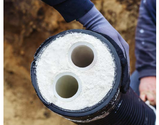
Ecoflex Thermo PRO