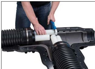
Katkaise virtausputket suoraan.