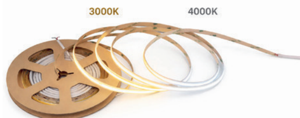
Värilämpötila vaihdettavissa 3000K/4000K