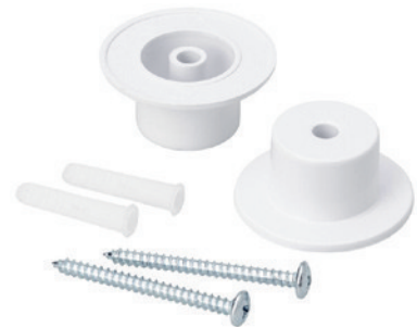
Valaisimen mukana toimitettavat lisätarvikkeet