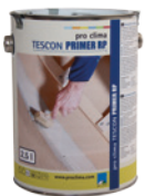
TESCON PRIMER RP Pohjustusaine