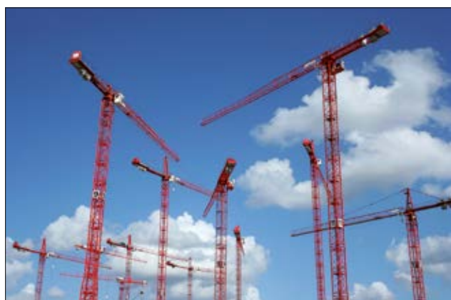
LTS - terässuojaletku soveltuu erinomaisesti ulkokäyttökohteisiin.