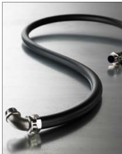
LTS - galvanoitu terässuojaletku PVC-vaipalla.

Tuoteohjelmassa kysyttäessä myös nestetiiviit suojaletkut polyuretaanivaipalla (PU).