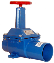
82 padotus sgps 100