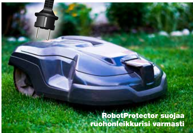
RobotProtector suojaa ruohonleikkurisi varmasti

Maadoitetun turvasuluilla varustetun 16A/250V kaksoispistorasian ja sekä verkon että rajajohtimien ylijännitesuojien yhdistelmä. RobotProtector on erityisen sopiva arvokkaan robottiruohonleikkurisi suojaamisen ylijännitteitä jotka syntyvät esimerkiksi ukkosilmalla. Rajajohtimet ovat herkkiä indusoimaan salamaniskuista ylijännitteitä jotka voi rikkoa robotin latausaseman, ja siten myös koko robotin elektronikan. RobotProtector tulee asentaa niin lähelle robotin latausasemaa kuin mahdollista.