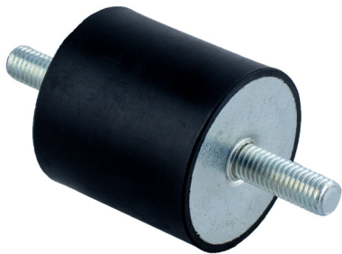
Vibropuks Tüüp 1

Silindrilisi antivibratsiooni pukse kasutatakse peamiselt pumpade, ventilaatorite, pesumasinate, elektrimootorite, juhtkappide ning muude tööstus- ja põllumajandusseadmete ja -masinate tekitatava vibratsiooni summutamiseks. Silindriliste pukside eelised: lihtne paigaldada, suur paindumus, ökonoomsus ja pikk kasulik iga.