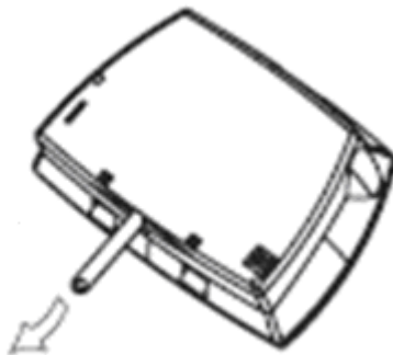
Kuva 3. Vedä aktivointinauha ulos kuten kuvassa ilmaistu.

Yksikkö toimii nyt, ja se on valmis käytettäväksi.