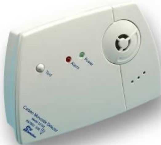
Kuva 1. Häkävaroitin SF450EN kuvattuna edestäpäin.

Laitetta tulisi testata kerran kuukaudessa painamalla ja pitämällä ”Test”-painiketta alaspainettuna vähintään 5 sekunnin ajanjakson. Mikäli laite toimii testissä normaalisti sen vihreä valo syttyy päälle, punainen alkaa vilkuttaa ja hälytyn antaa ääntä.