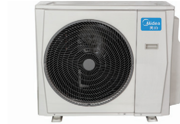
10,6 kW, 12,3 kW